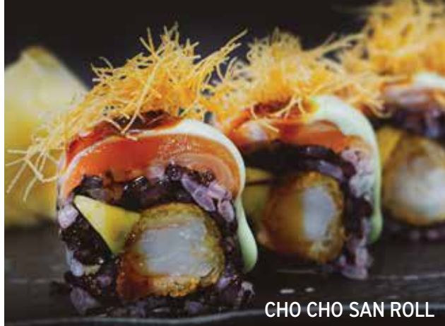
CHO CHO SAN ROLL

ρολλά ρυζιού με μαγιάντικο, truffle flakes και black caviar / inside out rice rolls filled with hamachi, truffle flakes and black caviar