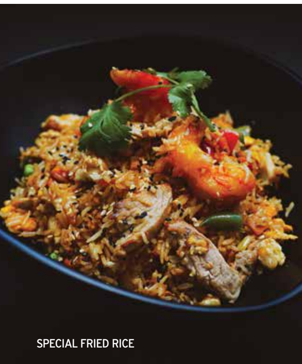
SPECIAL FRIED RICE

ταιλανδέζικο ρύζι με γαρίδες, γάλα καρύδας, ανανά και curry / thai rice with shrimps, coconut milk, pineapple and curry