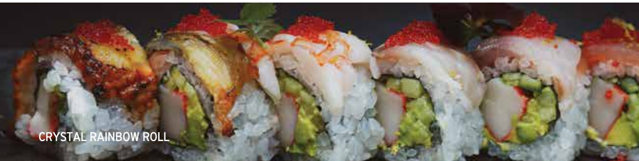
CRYSTAL RAINBOW ROLL

ρολλά ρυζιού με αγγούρι, αβοκάντο, guacamole με επικάλυψη καψαλισμένους mousse σολομού, pico de gallo, και teriyaki sauce / rice rolls with cucumber, avocado and guacamole, topped with seared salmon mousse, pico de gallo and teriyaki sauce