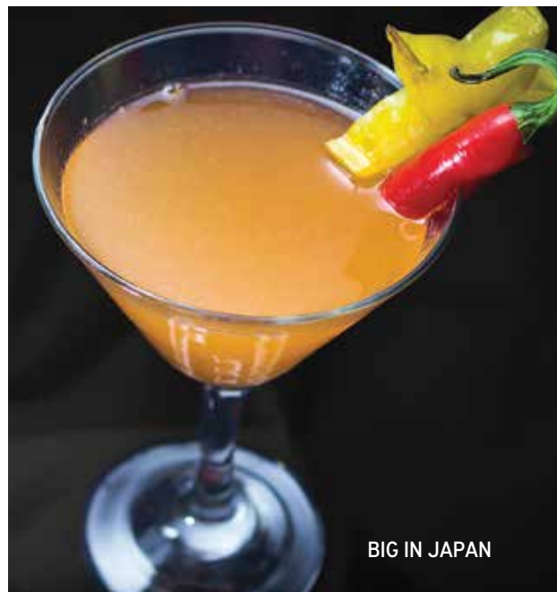
BIG IN JAPAN