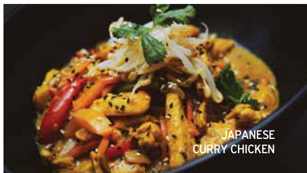
JAPANESE CURRY CHICKEN