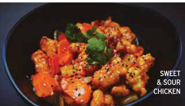
SWEET & SOUR CHICKEN

κοντροκομμένα λαχανικά, σε γάλα καρύδας με κourkouμά και σουσάμι / pieces of mixed veggies in coconut milk, tumeric and sesame seeds